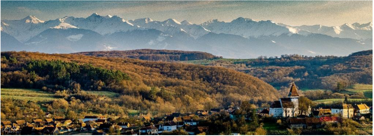
im April 2021

Die Firma hat im April begonnen, im Inneren der Kirche den schadhafte Putz zu entfernen. Damit können nun die Wände langsam trocknen. Ein Vorgang, der wahrscheinlich mindestens ein Jahr dauert.