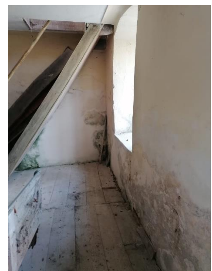
im März / April 2021

Da die Fichten gefällt wurden, kann nun das Erdreich trocknen. Das Fällen der hohen Fichten hat noch ein Vorteil: nun ist die Martinsberger Kirche von Weitem sichtbar und mancher Fotograf entdeckt plötzlich ein Juwel in einer atemberaubenden Landschaft, wie das folgende Foto zeigt.